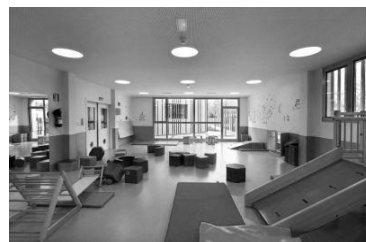
شکل ۲: مهد کودکی در زاراوتز ۱۱

انعطاف‌پذیری فضا به دلیل وجود دیوارها و مبلمان قابل‌تحرك توسط کودکان (Hi design, 2013)