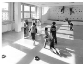
شکل ۳: مهد کودکی در برلین

حضور نور طبیعی در فضای بازی کودکان (Wang & Wang, 2013)