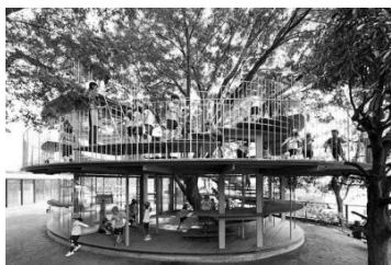
شکل ۴: مهد کودک فوجی ۱۲

استفاده از طبیعت و مصالح طبیعی در فضای بازی کودکان (Galindo, 2011)